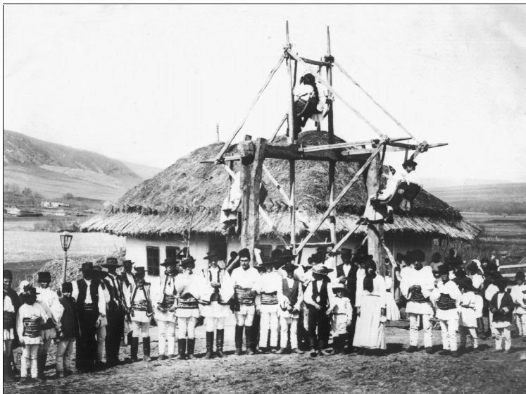
La horă, Cuci-Vaslui, 1904.